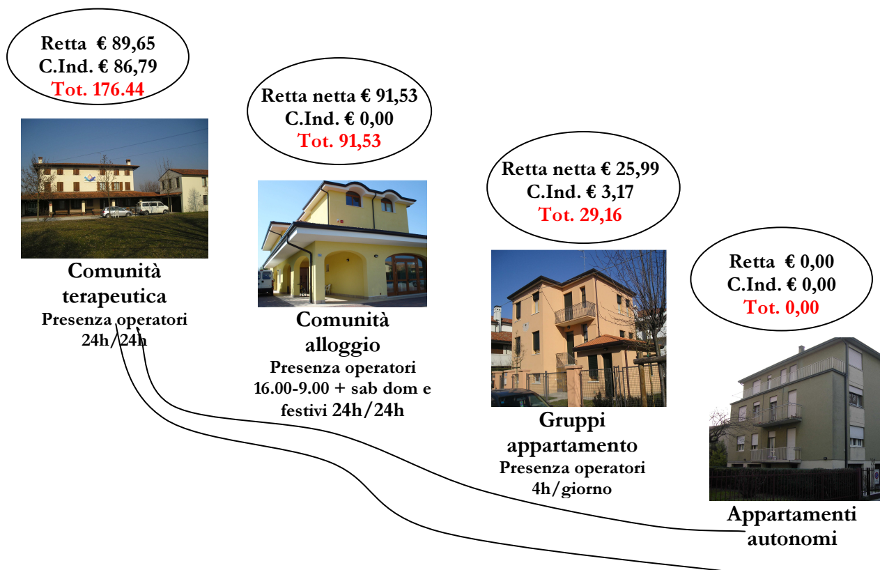
Figura 3.1 – I costi della filiera riabilitativa-abitativa per la pubblica amministrazione (media 2001-2011)

La figura riporta le voci di costo giornaliero diretto (la retta coperta dalla pubblica amministrazione al netto della parte che poi viene prelevata dall’utente in caso di parziale contribuzione) ed indiretto (il costo del personale dipendente impiegato presso le strutture residenziali) per ogni struttura. Come si osserva, il costo diminuisce progressivamente, ma con variazioni diverse, come già descritto, tra quota diretta e indiretta.