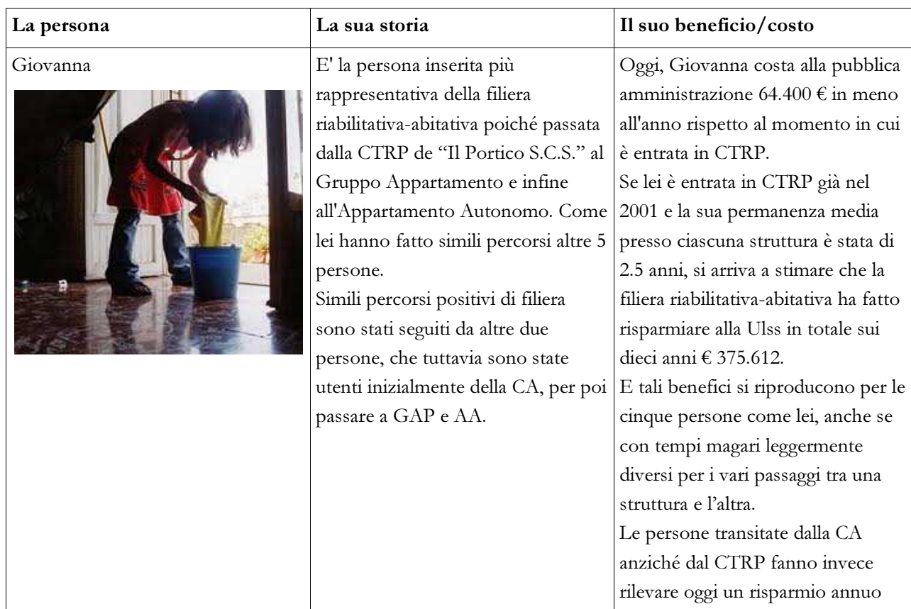
Tabella 3.2 – Le persone transitate nelle strutture

A questa domanda è possibile rispondere raccogliendo i dati sulle singole persone transitate nella cooperativa e sui percorsi da esse effettuati e interpretando gli stessi in due modi: (i) analizzando casi comparati di persone che sono transitate tra le varie strutture per spiegare anche con uno sguardo qualitativo cosa accade; (ii) analizzare tutti i costi sostenuti nei vari anni ed i risparmi generati quando le persone hanno compiuto i passaggi per arrivare ad individuare il risparmio complessivo.